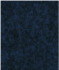
Navy Blue SJT03